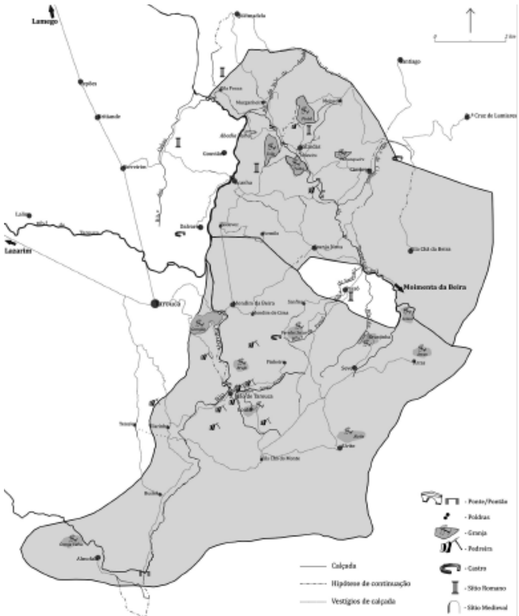
Figura 5 – Coutos monásticos e vias de circulação .