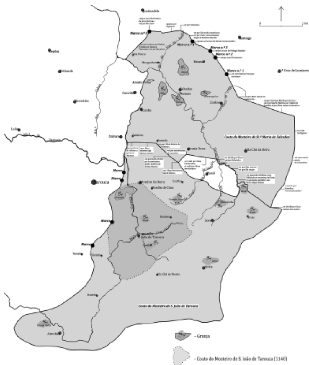
Figura 4 – Limites dos coutos monásticos.