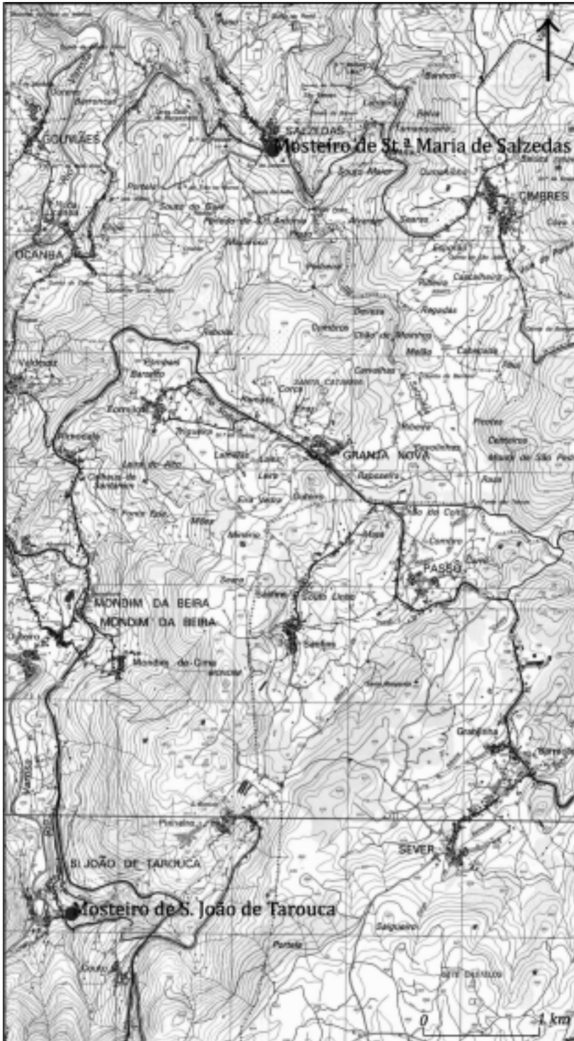
Figura 1 – Localização dos Mosteiros de S. João de Tarouça e St.ª Maria de Salzedas.