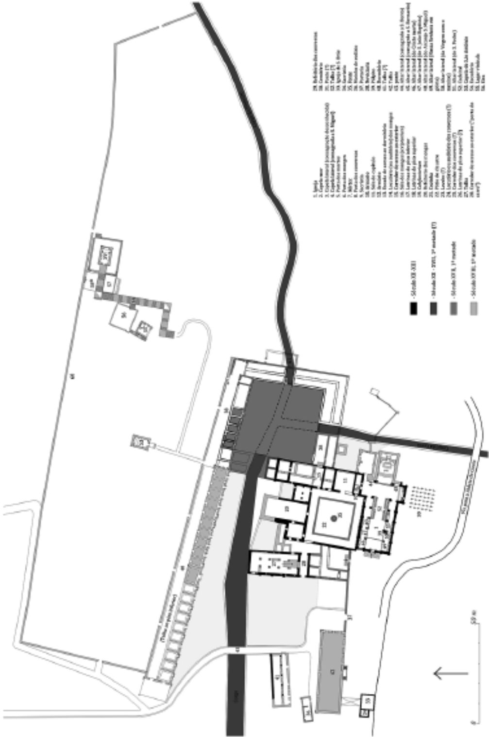
Figura 2 – Fases de construção do Mosteiro de S. João de Tiarouca