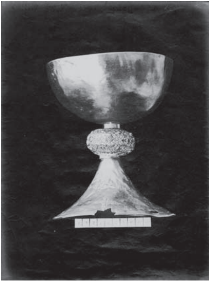
Figura 3 – J. Laurent (Madrid) – B-221. Calice en vermeil du monastère d'Alcobaça, à l'Académie royale des Beaux-Arts de Lisbonne, 1869. Dim. 33,7 x 25,3 cm (Col. particular).

tem-n'ó incumbido de variadíssimos trabalhos, já em retratos, já em reprodução de diversas mobílias e baixellas» 52 . Um jornalista lisboeta reagiu a estas encomendas afirmando: