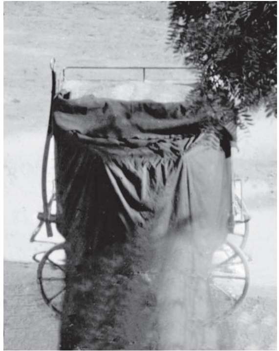
Figura 2b – Carro-laboratório de J. Laurent com o pano que isolava a câmara escura da luz exterior, em Salamanca, ca. 1866. Detalhe de negativo C-378-2 (ou 379) do catálogo da casa Laurent.

Em vez do carro-laboratório comum, onde o fotógrafo entrava e se fechava para revelar, Laurent construiu um curioso carro-laboratório. De pequenas dimensões e altura inferior à de um homem, tinha quatro rodas com molas amortecedoras, sendo as duas de trás fixas e as da frente de eixo móvel. Às da frente estava fixo um varão para tracção que terminava com uma pega. Este varão flectia para cima e podia colocar-se na posição vertical quando se parava o carro para trabalhar. As rodas eram por vezes calçadas com pequenas pedras para o estabilizar e horizontalizar. O corpo do carro, propriamente dito, era um paralelepípedo com duas portas de abrir, que ocupavam toda a extensão de um dos lados. Deste lado do tejadilho saía um grande pano escuro, provavelmente duplo, para melhor isolar a luz do exterior, que