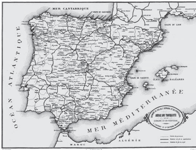
Figura 1 – Mapa dos caminhos de ferro na Península Ibérica, em 1879 (Roswag, 1879).

Na altura em que Laurent veio a Portugal, o caminho de ferro já servia uma parte significativa dos trajectos que percorreu. Outros apenas se podiam fazer utilizando transportes de tracção animal, ou no dorso de cavalos e mulas 32 . Em 1869, o caminho de ferro ligava Madrid a Lisboa, atravessando a fronteira por Badajoz-Elvas, e Lisboa (estação de Santa Apolónia, no Cais dos Soldados) a Vila Nova de Gaia (estação das Devesas). A norte do rio Douro ainda não estava construído. Na margem sul do Tejo, o caminho de ferro estava em funcionamento do Barreiro até Setúbal, Évora e Beja (Figura 1) 33 .