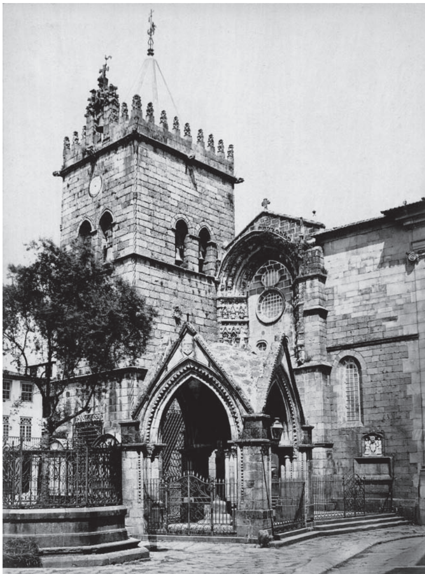
Figura 4a – J. Laurent (Madrid) – C-870. Guimaraens. Vue de Notre Dame des Oliviers , 1869. Dim. 34,1 x 25,4 cm (Col. particular).

e C-817, respectivamente, correspondendo apenas à inclusão no catálogo de uma segunda vista do mesmo tema, que inicialmente não se previa incluir, ou que não se terá numerado na altura em que foi tirada, facto que também se verifica em fotografias suas de Espanha 60 .