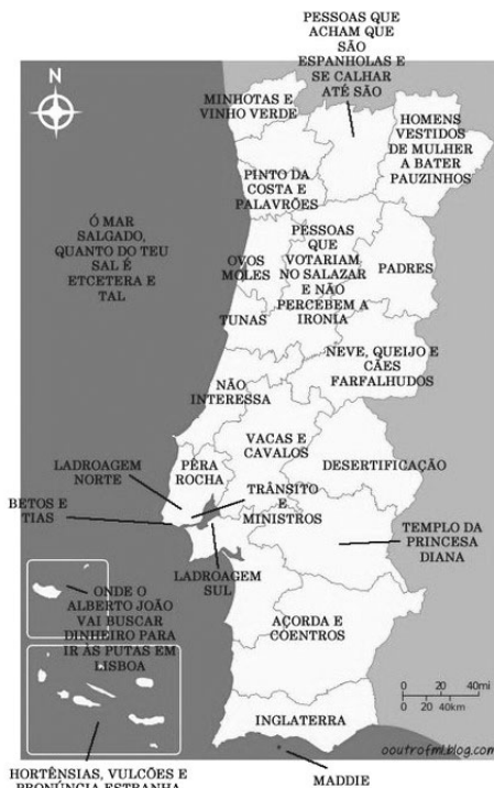
Figura 1 – Portugal em palavras