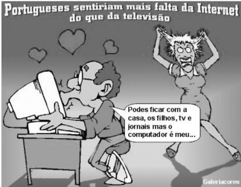
Figura 2 – Amor pela internet