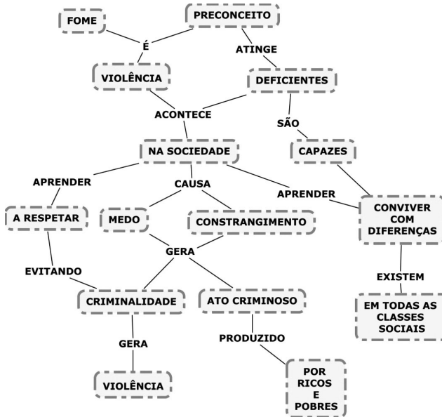
Figura 4 - MAPA CONCETUAL – Fonte: http://projetosgam.pbworks.com/w/page/19295974/Fome%20Viol%C3%83%C2%AAncia%20e%20Preconceito