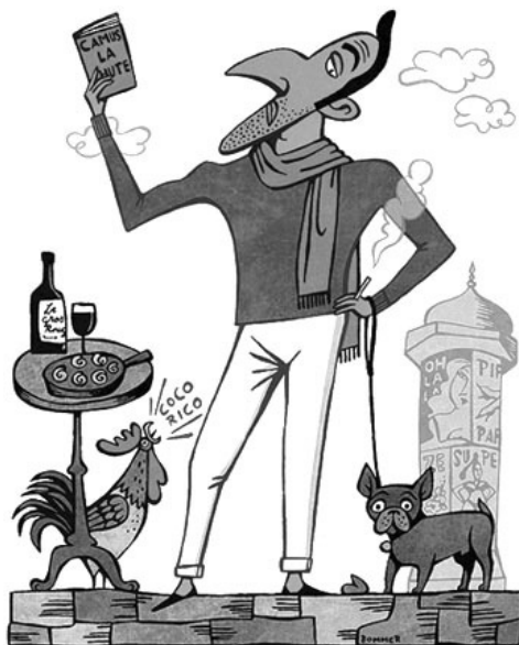
Figura 3 – Um francês de França