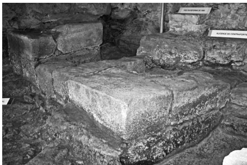
Fig. 3 – Estrutura maciza.