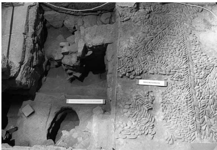
Fig. 7 - Área metalúrxica.