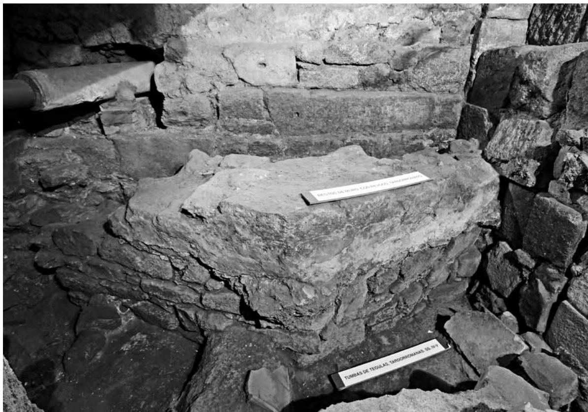
Fig. 8 – Muros do posible baptisterio e tumbas de tégulas.