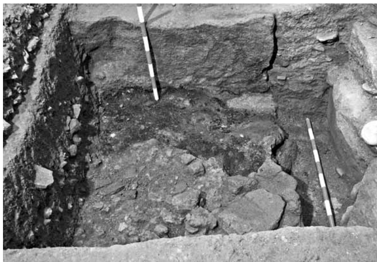
Fig. 6 - Forno.