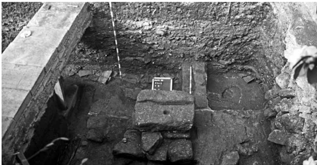
Fig. 2 – Depósitos do xardín.