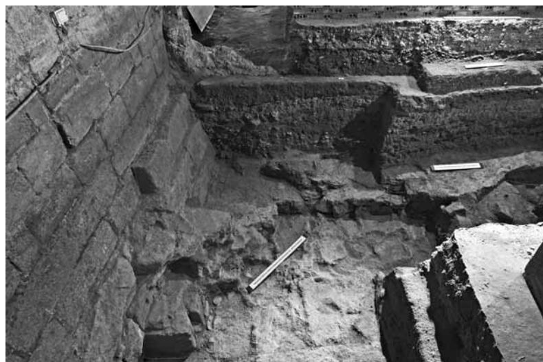
Fig. 4 – Estrutura monumental.