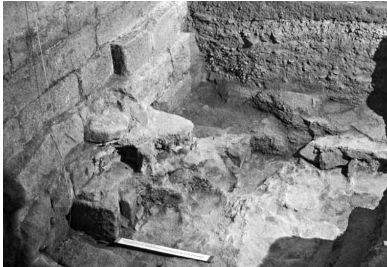
Fig. 5 - Detalle da mesma.