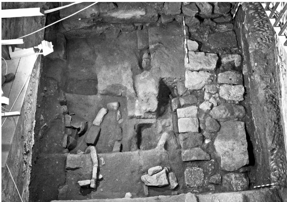
Fig. 9 – Necrópole tardorromana e altomedieval.