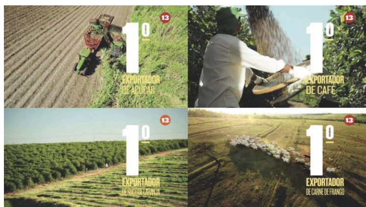
Figura 3: propaganda de Dilma Rousseff destaca grandiosidade do agronegócio.

Em termos ambientais, a campanha dilmista exibiu muitas áreas verdes, como a vegetação em ambientes externos, florestas, jardins e campos. Contudo, fez-se pouca referência ao meio ambiente e nenhuma à sustentabilidade. O que se expôs foi um ideal de desenvolvimento sem adjetivação, isto é, não houve espaço ou desejo pelo desenvolvimento sustentável , por respeitar o tempo da terra, pelo manejo cuidadoso dos recursos naturais. O grande Brasil agendado foi o do agrobusiness , que entende o meio ambiente como matéria-prima para a produção crescente de produtos, destacadamente, os exportáveis.