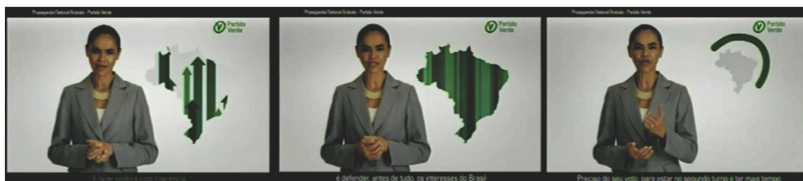
Figura 1: Marina Silva e o verde onipresente.

Marina Silva (PV/PSB) se colocou como uma espécie de terceira via, uma alternativa para além da disputa entre os dois principais partidos brasileiros, no que classificou como “ a luta do poder pelo poder ”. A personalização das campanhas eleitorais ganhou realce, pois se propôs uma nova ontologia política com foco no desenvolvimento sustentável, convocando figuras que transitaram entre diferentes mundos – a candidata é quem conseguiria interligar sem tensões o melhor dos dois polos, ou seja, a floresta e a cidade, o passado e o futuro, os melhores quadros de todos os partidos e os melhores estudiosos da academia com a sociedade. Marina Silva concatenaria um novo Brasil a uma nova forma de fazer política, com mais eficiência e menos desperdício. Sob outra perspectiva, ela seria o ponto que apaziguaria inquietações entre o desmatamento e a preservação. Contudo, a considerar tais proposições, não se viu demonstração de como realizá-las, tendo apenas se apresentado a ideia de valorização dos abundantes recursos naturais e conversão do desperdício de dinheiro público em saúde de qualidade, em educação transformadora e em mais segurança.