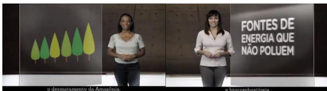
Figura 2: propaganda de Dilma Rousseff destaca a redução do desmatamento na Amazônia e a produção de biocombustíveis

A campanha de Dilma Rousseff (PT), por sua vez, anunciou o interesse no “ desenvolvimento ambiental e tecnológico ” e, muitas vezes, apresentou a candidata com vegetações em segundo plano. Fez, ainda, algumas referências diretas ao meio ambiente, chegando a exibir atrizes que destacaram a busca por fontes de energia renovável como um objetivo da presidenciável. Falou-se em turbinas eólicas, redução do desmatamento na Amazônia e luta contra o aquecimento global. O meio ambiente que surgiu na propaganda dilmista visou o desenvolvimento tecnologizado, próximo à ideologia da ecoeficiência. No segundo turno, a candidata petista agendou com muito mais contundência o meio ambiente, promovendo inúmeras referências textuais, verbais e visuais de forma direta e indireta. A preservação do meio ambiente figurou como um ideal a ser alcançado de forma concomitante ao desenvolvimento.