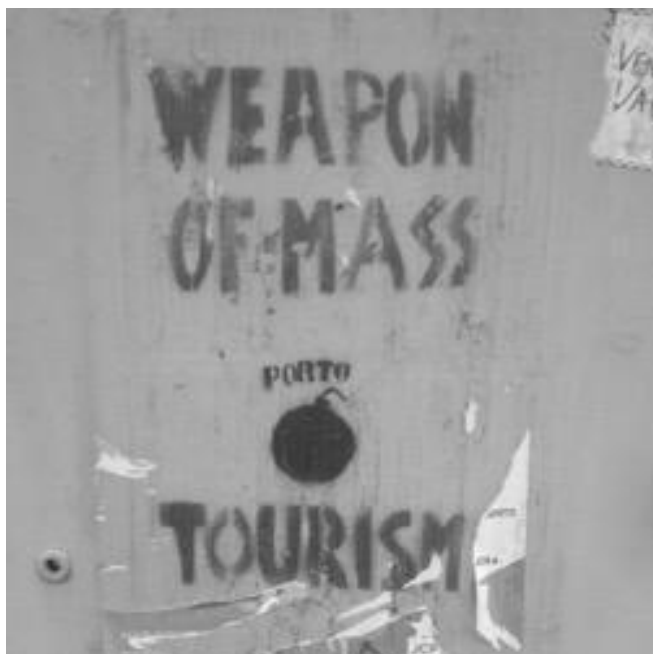
Figura 1, Rua Duque de Loulé

O impacto da turistificação na vida dos cidadãos e cidadãs parece bastante evidente. Numa colagem, encontrada num viaduto, junto à Foz, podia-se ver uma rua repleta de turistas acompanhada da figura do desenho-animado Sandoku e da frase "Deixem-nos respirar"!, sugerindo a exaustão provocada pelo contacto permanente com a multidão de pessoas nalgumas ruas centrais do Porto.