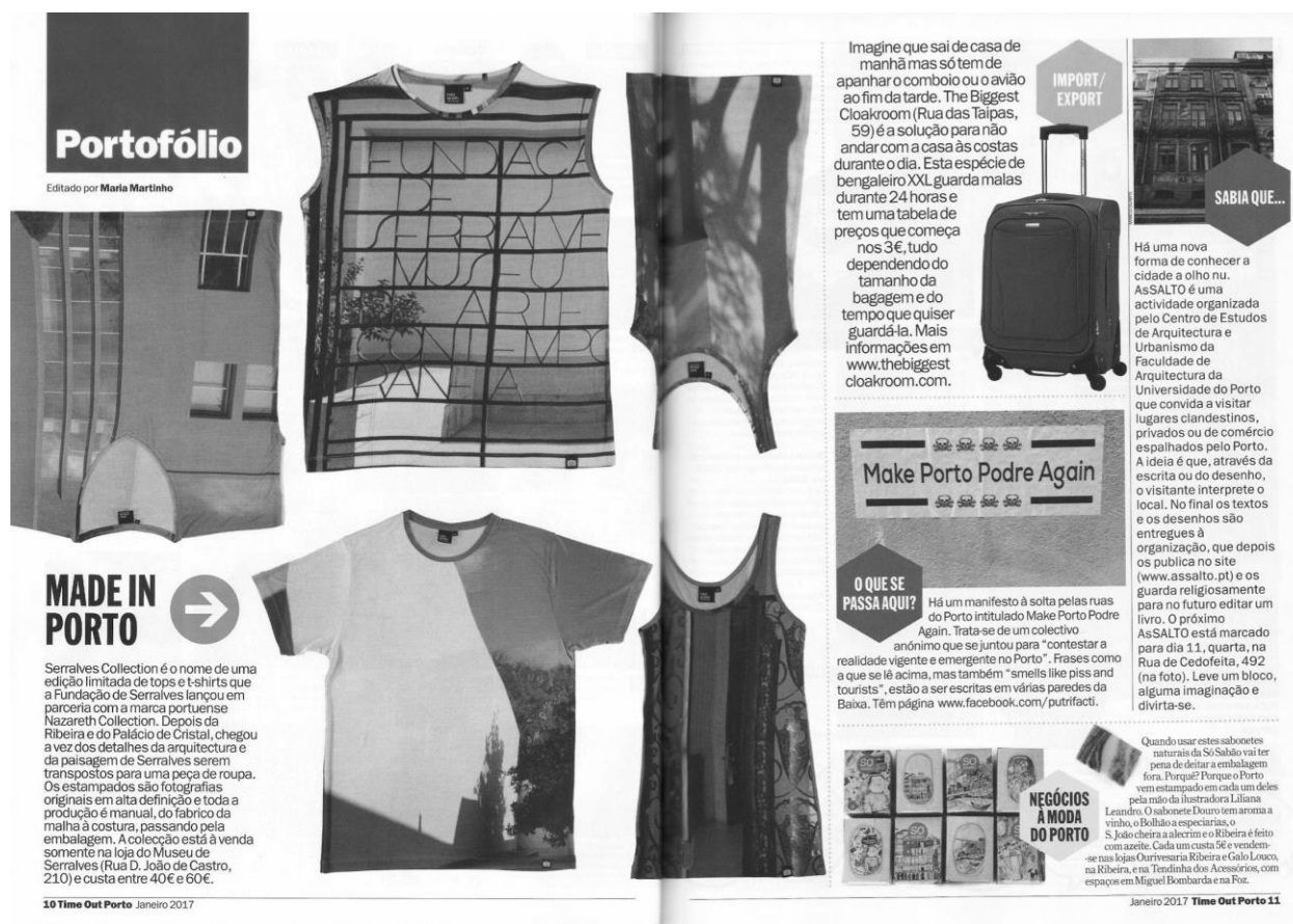
Figura 2 - Páginas 10 e 11, da Time Out Porto , janeiro de 2017

As expressões provocadoras "Porto Morto", "Morto: Best European Gentrification" ou, simplesmente, "Morto" projetam também a extinção da cidade genuína. Foram criadas a partir de uma recomposição da imagem publicitária do município, Porto, ponto 11 , marca estabelecida no decorrer de um plano estratégico de promoção do turismo. Paradoxalmente, no Manual de Identidade 12