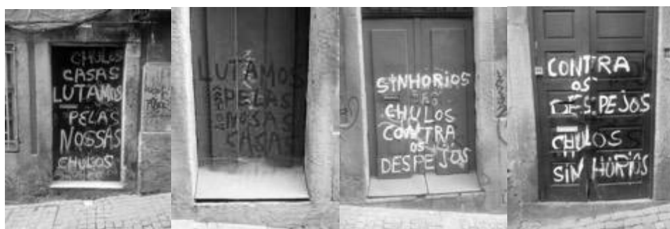
Figura 4 - Sequência de imagens, Rua dos Mercadores (IB)

Se estas imagens nos dão conta da raiva e indignação do autor, a insistência com que se usa as paredes para comunicar é visível num outro exemplo, também sobre especulação. Num taipal junto ao Palácio do Bolhão lê-se: “Especulador é uma carraça, a cidade vira carcaça”. Em baixo, entre parêntesis, o mesmo autor escreveu “apagam, volto a escrever”. O conteúdo da frase e a superfície onde foi escrita não será coincidência. O taipal esconde a cratera deixada pelas obras inacabadas do Quarteirão da Casa Forte 15 , situação que se mantém há alguns anos, envolta numa teia nebulosa de informações. O emprego de trocadilhos e rimas é mais uma vez a estratégia usada, associando a figura