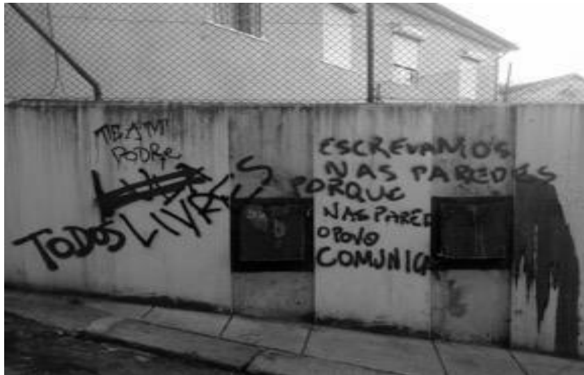
Figura 6 - Rua da Formiga

As contra-visualidades, com as quais nos fomos deparando, atuam como um grito que se expressa nas paredes, que se ressignifica pela ação dos outros, que é riscado, rasgado, adulterado, desgastado pelo tempo, numa contínua emenda, como vozes que se sobrepõem produzindo ruído. O ruído é por vezes silêncio, quando as paredes escritas são pintadas de branco, num gesto de anulação