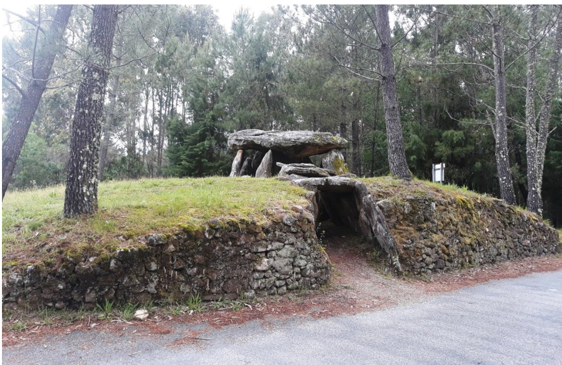
Figura 1 – Mamoa/Dólmen 1 da Cerqueira

O caso que aqui irá ser alvo de análise é composto por estas duas construções, de certa forma complementares.