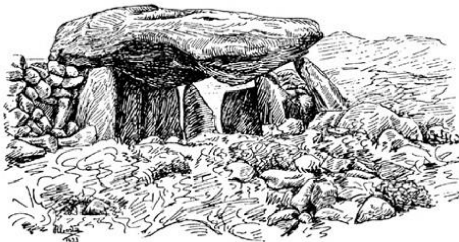
Figura 3 - Desenho da Mamoa/Dólmen 1 da Cerqueira em 1921