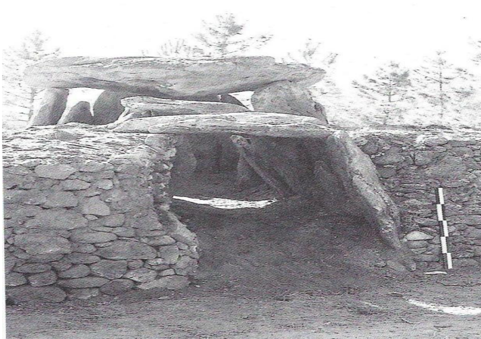
Figura 5 - Vista da câmara, do corredor e do muro de suporte à Mamoa/Dólmen 1 da Cerqueira, após a finalização dos trabalhos de restauro e consolidação de 1988.

O avançado estado de erosão em que se encontrava a mamoa e o corte nela provocado pela construção de uma estrada (como já antes se referiu) exigia uma consolidação da mesma, tendo para isso sido construído um muro de pedra granítica em frente à parte afetada, para a sua sustentação. À volta da restante mamoa, para delimitar a sua dimensão, foi construído um muro de pedra baixo, após conversações com os proprietários dos terrenos (Bettencourt, 1989).