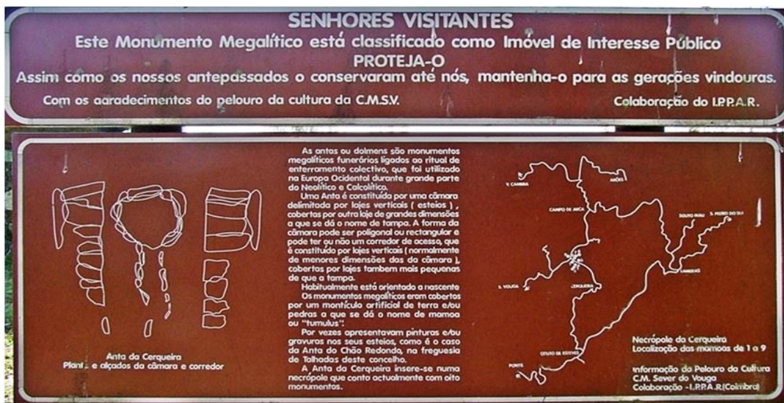
Figura 7 - Placa identificativa situada ao lado da Mamoa/Dólmen 1 da Cerqueira

A placa identificativa apenas possui um mapa da região, identificando a necrópole dolménica da Cerqueira, a planta deste dólmen e uma muito breve explicação da arquitetura e função deste monumento (longe de as descrever na totalidade).