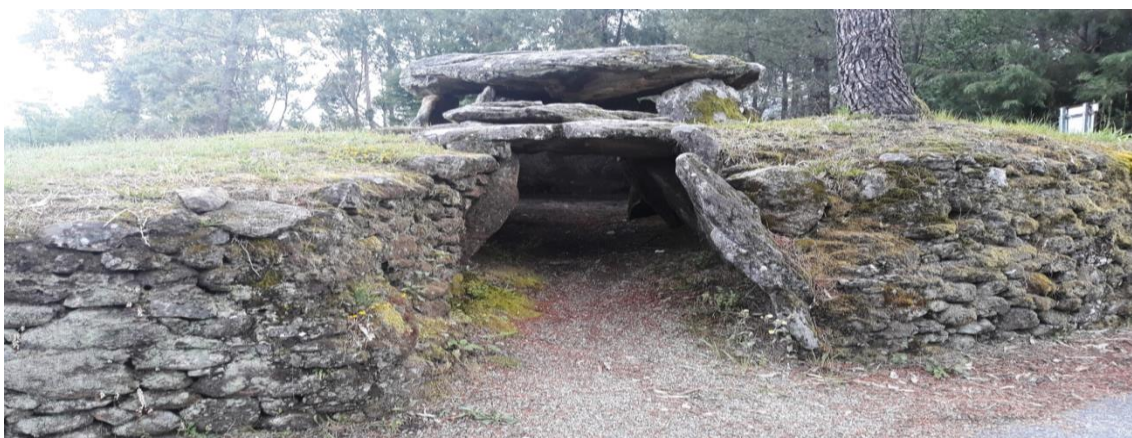
Figura 6 - Mamoa/Dólmen 1 da Cerqueira atualmente, com sinais de degradação

Após estes trabalhos de escavação, consolidação, conservação e restauro este monumento não foi alvo de mais nenhuma atividade ou projeto, apesar da sua classificação como Imóvel de Interesse Público em 1990, como se referiu acima. Possui apenas uma placa identificativa ao seu lado, mas ainda que a zona envolvente se encontre limpa, o monumento apresenta já sinais de degradação, como o desaparecimento de uma tampa do corredor, a derrocada de parte do muro de proteção da mamoa e a inclinação de alguns esteios, talvez devido às raízes de um pinheiro que cresce nas proximidades.