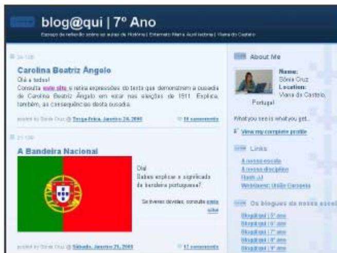
Figuras 2 - Blog@qui do 6º ano