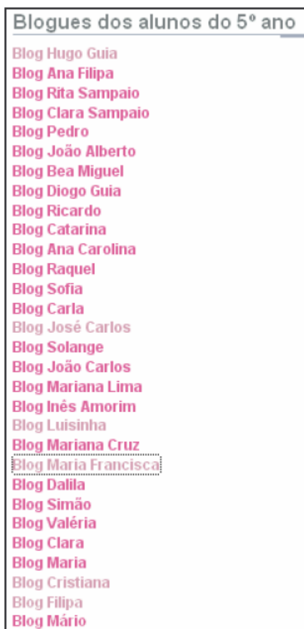
Figura 13 - Listagem dos blogues criados pelos alunos do 5º ano

para a criação do seu próprio blogue devido à impossibilidade, por parte da escola, em garantir o acesso à sala de informática. Os blogues dos 46 alunos que criaram o seu blogue pessoal foram listados no blogue da disciplina, para facilitar a consulta à docente, aos alunos e aos próprios colegas (Figuras 13 e 14).