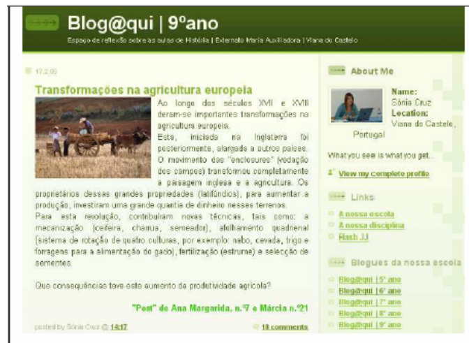
Figura 4 - Blog@qui do 8º

Os alunos começaram por ser confrontados com desafios (em formato de texto, imagem ou desenho) lançados no blogue pela professora relacionado com os conteúdos programáticos leccionados na aula e que tinham de solucionar. Vemos, o exemplo do Blog@qui do 7º ano em que a professora lança um desafio, ao qual os alunos respondem e, por vezes, voltam a responder ao desafio completando as suas respostas anteriores (Figura 5).