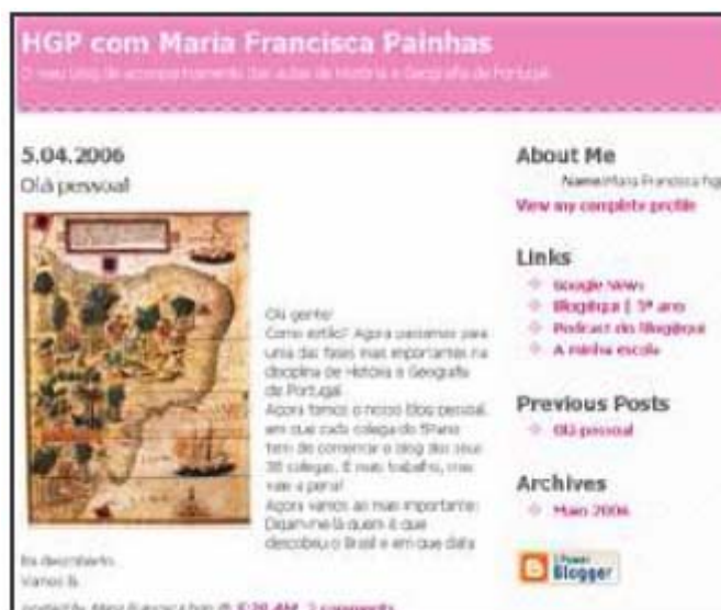
Figura 10 – Blogue criado por uma aluna do 5ºano

Numa última fase, a fase quatro, os alunos foram convidados a construir o seu próprio blogue para o integrar no blogue da disciplina a fim de lançar desafios aos quais os colegas e a professora respondiam, reforçando a comunidade de aprendizagem (Figuras 10 e 11).