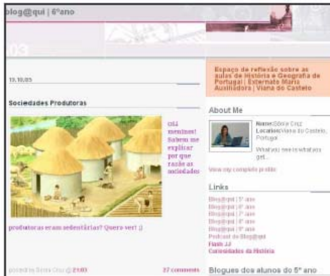
Figura 1 – Blog@qui 5º ano