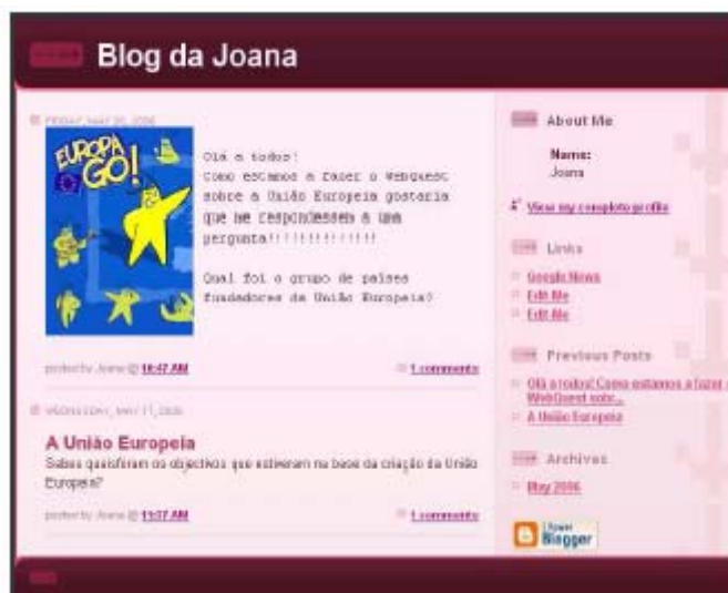
Figura 11 - Blogue criado por uma aluna do 6º ano

No blogue pessoal, os alunos lançam questões aos colegas de turma, para que estas sejam resolvidas. Verificou-se que muitos