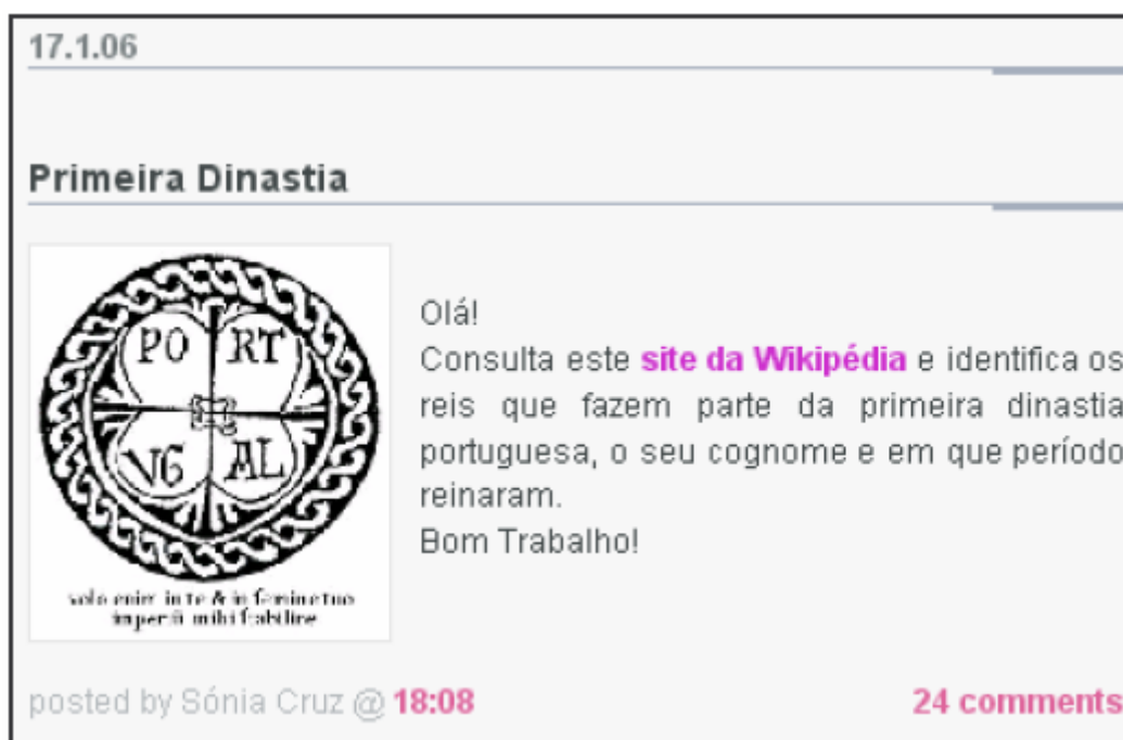
Figura 6 – Desafio lançado no Blog@qui do 5º ano

Na segunda fase, os alunos foram confrontados com desafios que os remetiam para a análise de sites, a partir dos quais se tornava possível solucionar esses desafios. Nesta fase, além do refinamento das competências de análise e interpretação das fontes, os alunos foram desafiados a cruzar informações, o que contribuiu para a construção de uma visão do facto histórico em causa. Por exemplo, no blog@qui do 5º ano foi lançado um desafio sobre a primeira dinastia do reino de Portugal, em que se solicita a realização de uma genealogia dos reis que integraram a primeira dinastia portuguesa (Figura 6 e 7). A partir das descobertas proporcionadas pela pesquisa efectuada, os alunos responderam ao desafio.