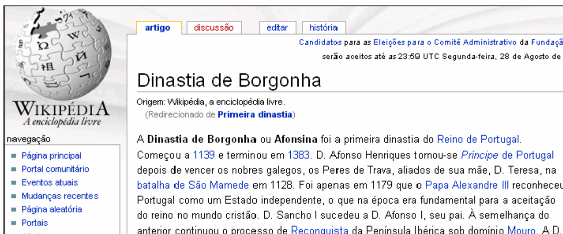
Figura 7 – Site a que os alunos deviam recorrer para responder ao desafio lançado no Blog@qui do 5º ano

Numa terceira fase, começaram a ser os alunos a lançar desafios no blogue da disciplina com vista à reflexão pela turma. Todos os alunos escrevem textos, publicam desenhos, tecem opiniões sobre o facto histórico em causa e sugerem ligações para outros sites, o que implica que o aluno averigue a informação de outros sites para os sugerir. Acreditamos que os alunos não podem ficar limitados a dar respostas (o que sugere o fim de uma discussão) para começar a contribuir com reflexões, experiências e questões (que sugerem continuação da discussão).