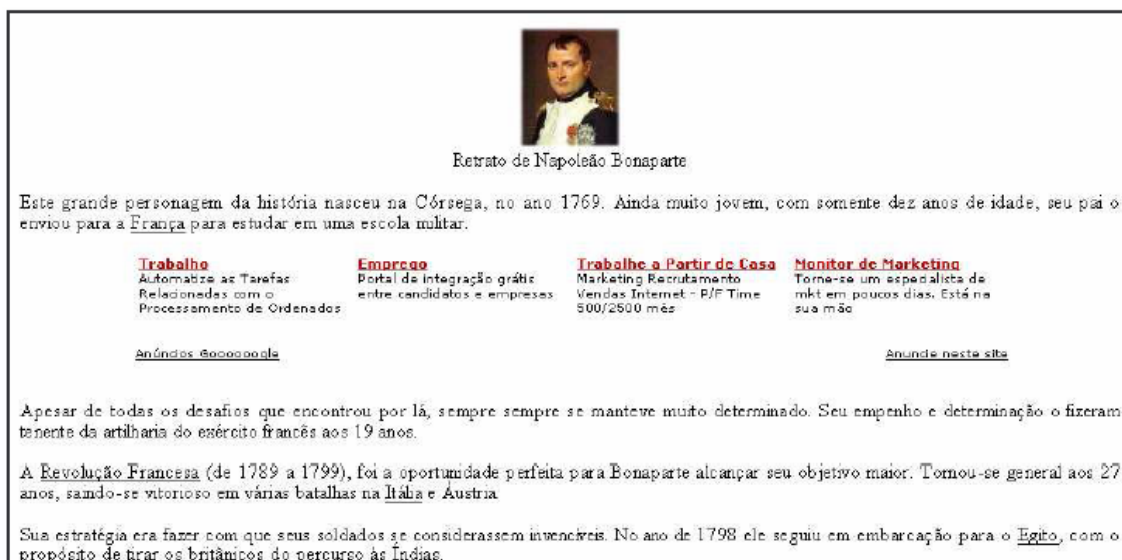
Figura 9 – Site sugerido pelo aluno para que os colegas solucionassem o desafio por ele lançado no Blog@qui do 8º ano