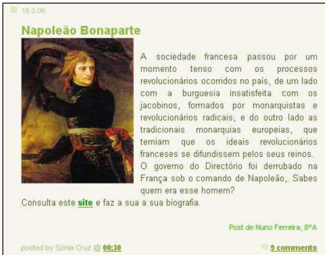
Figura 8 – Desafio lançado por um aluno no Blog@qui do 8º ano