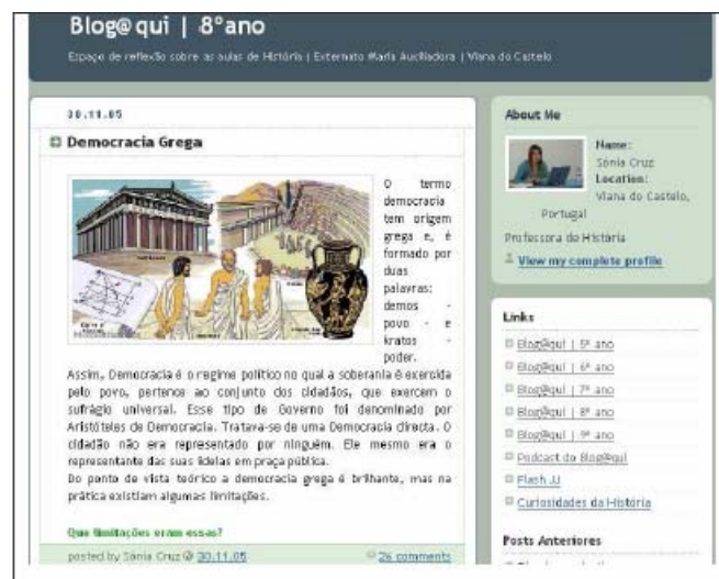
Figura 3 - Blog@qui do 7º ano