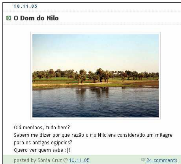
Figura 5 - Blog@qui do 7º ano

Os alunos começaram por ser confrontados com desafios (em formato de texto, imagem ou desenho) lançados no blogue pela professora relacionado com os conteúdos programáticos leccionados na aula e que tinham de solucionar. Vemos, o exemplo do Blog@qui do 7º ano em que a professora lança um desafio, ao qual os alunos respondem e, por vezes, voltam a responder ao desafio completando as suas respostas anteriores (Figura 5).