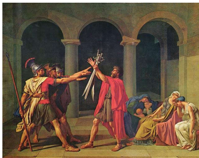
Figura 1: O juramento dos Horácios (1784), de Jacques L. David

A obra O juramento dos Horácios (1784), de Jacques Louis David (Figura 1), por exemplo, retrata três irmãos em pé, vestidos para a guerra, com braços com músculos bem definidos estendidos na direção do pai, que ergue três espadas no centro da pintura. Em segundo plano, três mulheres sentadas no canto inferior direito, resignadas. O contraste é evidente. Os homens ostentam expressões de bravura e olhares destemidos. O vermelho de seus trajes remete ao sangue do triunfo e à violência da guerra. Já as mulheres, por sua vez, têm semblantes de tristeza e sofreguidão, as cores das suas roupas em tom pastel e os corpos curvados, sem tônus e submissos à dor. O quadro atesta a virilidade e o voluntarismo dos homens, contrapostos à fragilidade das mulheres. A revista The Young Physique (Figura 2) nos anos 1960 e seus modelos de beefcake 93 , aqui neste caso, disfarçado de guerreiro romano, são exemplos de que o corpo masculino camuflado de herói podia ser exibido sem perder seu status viril e preservar os mesmos estereótipos dos cânones clássicos.