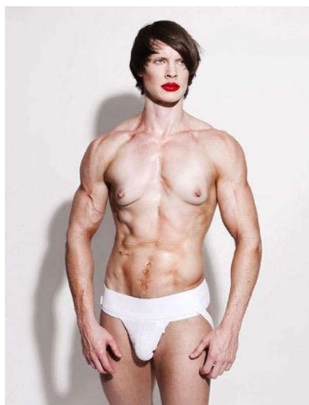
Figura 6: Cuts: A Traditional Sculpture de Heather Cassils, 2011

O discurso hegemônico heteronormativo masculino impõe condutas, comportamentos e subjetividades a fim de enquadrar os indivíduos às normas preestabelecidas, entretanto o corpo trans nos oferece novas linguagens. As imagens desses corpos “desobedientes” são fundamentais precisamente por serem capazes de desestabilizar o discurso que naturaliza o sexo em seu aspecto biológico e a fixação do gênero acoplado a um órgão sexual.