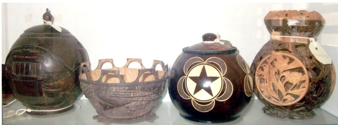
Imagem 2: Peças em coco produzidas no CRA/DRA. Coleção do CNAD (2012). Atente-se nos desenhos das duas caixas que exibem um trapiche (estrutura de moagem de cana de açúcar usada no fabrico de grogue) e a estrela negra da bandeira do PAIGC/PAICV.

Durante a chefia de Luís Tolentino (até 1983), descrito por todos como dotado de uma notável criatividade, este centro possuiu uma pequena secção de carpintaria onde terão sido produzidos brinquedos e mobiliário doméstico e urbano. Porém, o grosso da produção consistiu, desde o seu início até ao seu encerramento, em pequenos objetos elaborados a partir de casca de coco (candeeiros, serviços de café, jarras, caixas, cinzeiros) minuciosamente esculpidos com desenhos alusivos à paisagem e cultura do país. A par da casca de coco, a matéria-prima mais utilizada, usou-se ainda bambu, chifre, carapaça de tartaruga e osso de baleia. Todos os entrevistados sublinharam a “qualidade excepcional” do trabalho realizado, manifestando um entendimento do seu ofício próximo do formulado por Sennett (2008), enquanto disposição para “fazer as coisas bem”. Foi ainda frisado o grande prestígio alcançado por estes objetos em Cabo Verde, patente na emissão de uma série de selos postais em 1977 com imagens destes artefactos e nas exposições realizadas no estrangeiro. Tal como a produção da sede do CNA no Mindelo, também estas peças eram inacessíveis à maioria da população, sendo uma boa parte da produção adquirida pelo Estado.