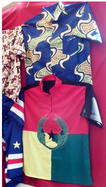
Imagem 5: Em cima, camisa em tecido wax print. Em baixo, camisa alusiva à primeira bandeira de Cabo Verde (Feira de artesanato na Rua 5 de Julho, Praia, 2015).