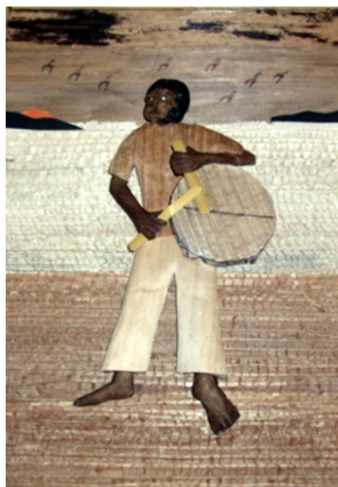
Imagens 6 e 7: Quadros com colagem de fibras de bananeira realizados por reclusos. Cadeia Central de S. Vicente, Mindelo, 2015.