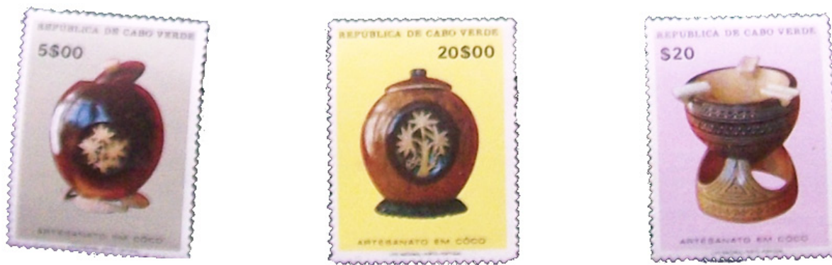
Imagem 3: Selos postais com imagens de peças do CRA.