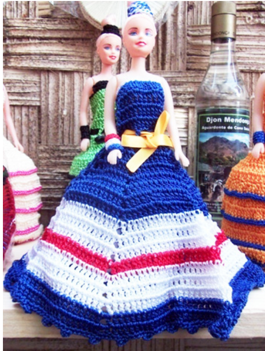
Imagens 4: Vestido de boneca em croché com as cores da bandeira nacional (Feira de artesanato na Rua da Luz, Mindelo, 2014).