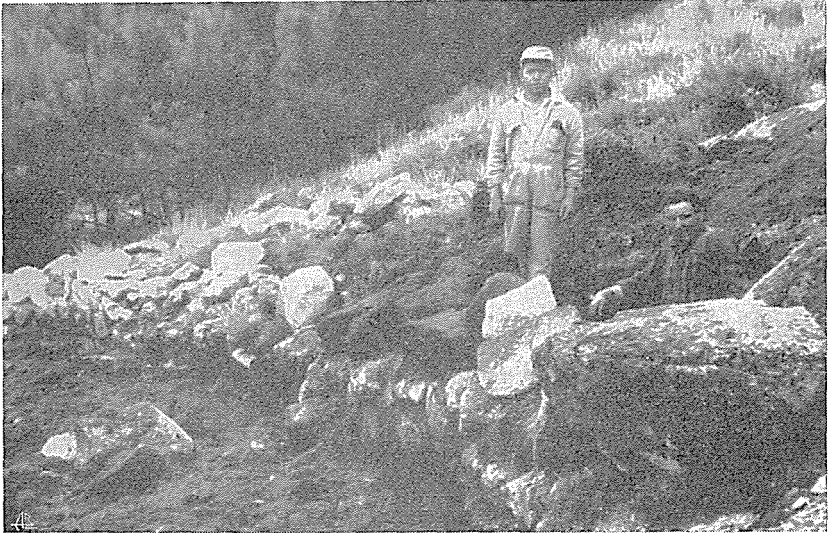
Fig. 1 — Muro da vertente leste do Castro de Carvalhos reduzido quase ao alicerce. O homem que se vê por trás do penedo onde o muro entesta indica o local preciso do achado da moeda e fíbula

no último e penúltimo dias da campanha de escavações, pelo que a crivagem da terra teve que ficar para uma próxima campanha, que espero poder realizar no próximo mês de Agosto.