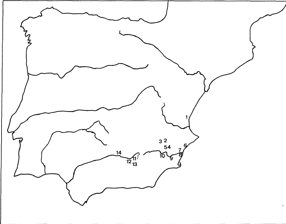
Fig. 1 — Localización de los yacimientos citados: 1) La Solivella; 2) Los Villares; 3) Pozo Moro; 4) El Prado; 5) Coibra del Barranco Ancho; 6) La Albufereta; 7) Elche; 8) El Molar; 9) Cabecico del Tesoro; 10) El Cigarralejo; 11) Castellones de Ceal; 12) Galera; 13) Baza; 14) Porcuna.