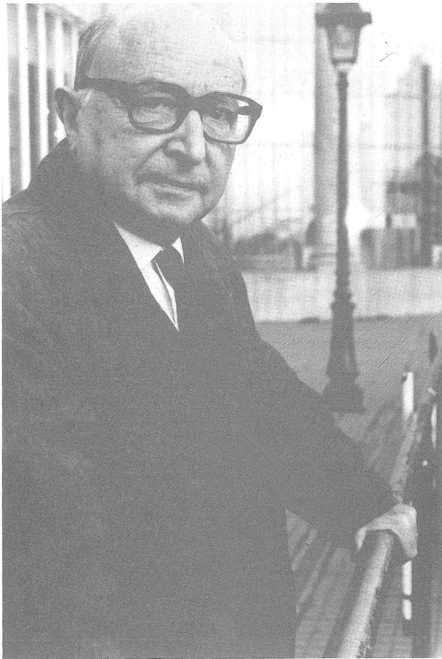
Fig. 1 – Prof. Luc de Heusch.