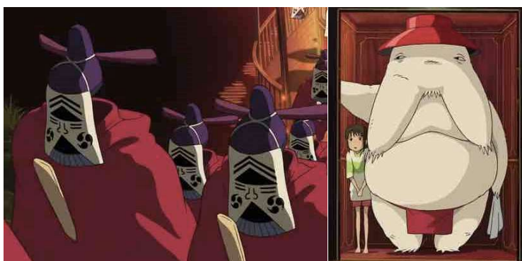
Figure 5. Kasuga-sama (left) and Oshira-sama or Radish Spirit (right)

An interesting finding in the qualitative analysis is that some examples suggest high target orientation of the English dubbing and high source orientation of the English subtitling. A good example of this is the translation of Kasuga-sama , which refers to a group of deities from the Kasuga shrine. Kasuga comes from a place name. The reference is used only once in the ST and is irrelevant to the storyline. The image of the reference and its translations are shown below.