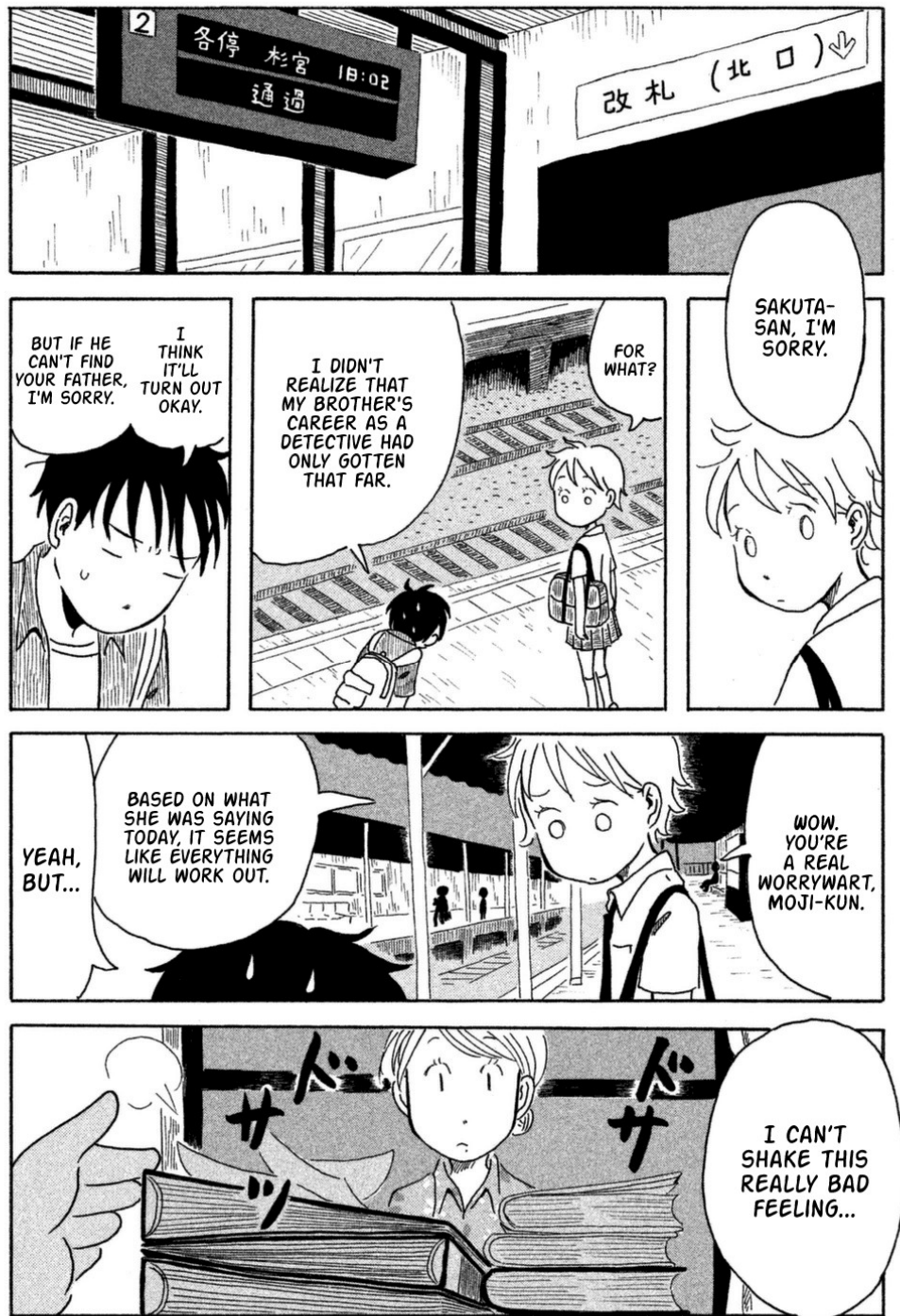
Figure 2. Kodomo Wa Wakatte Agenai , volume 1, p. 54.