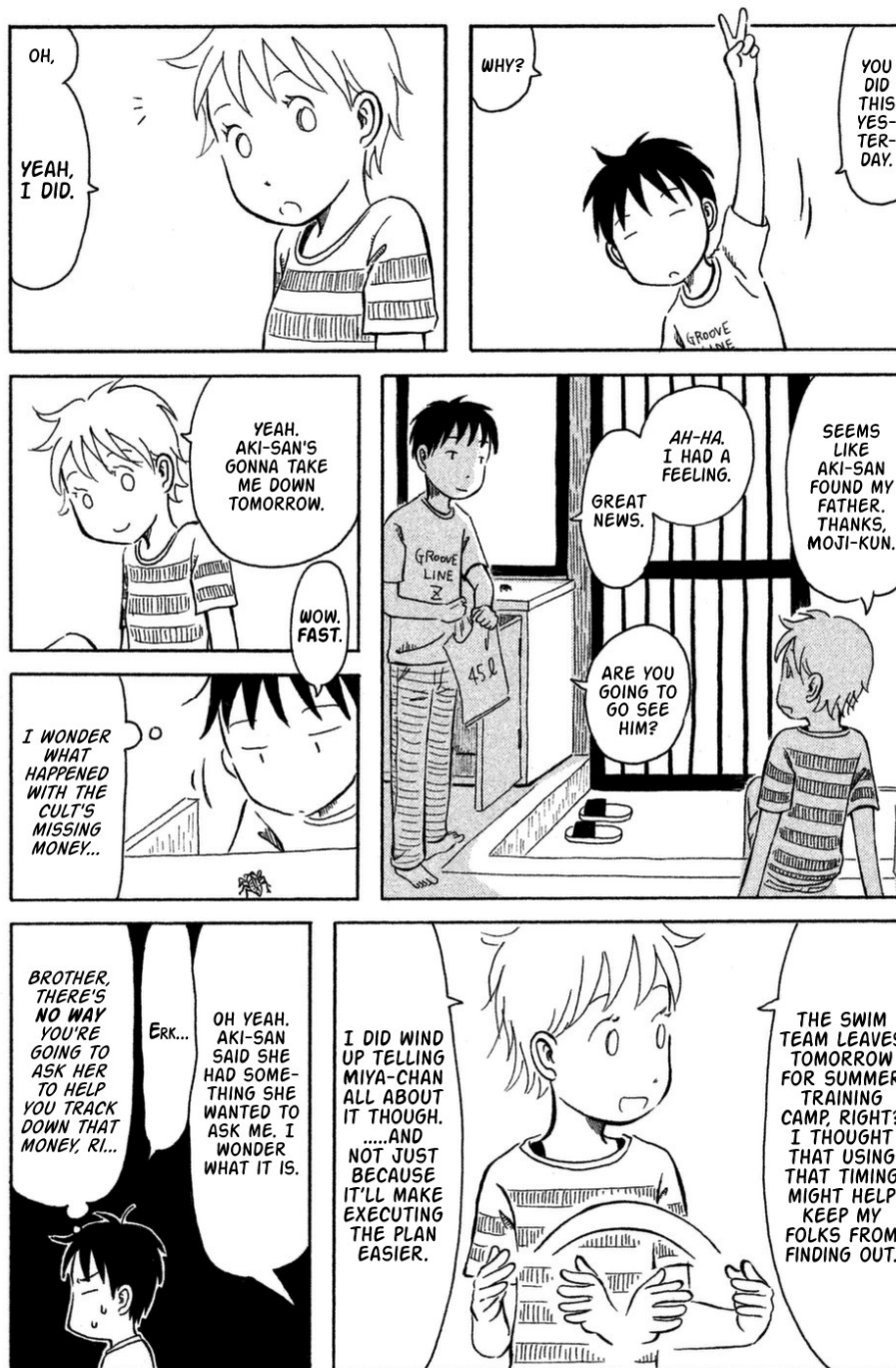
Figure 3. Kodomo Wa Wakatte Agenai , volume 1, p. 102.

Returning to the same issue in a later chapter, Vhix further explained: